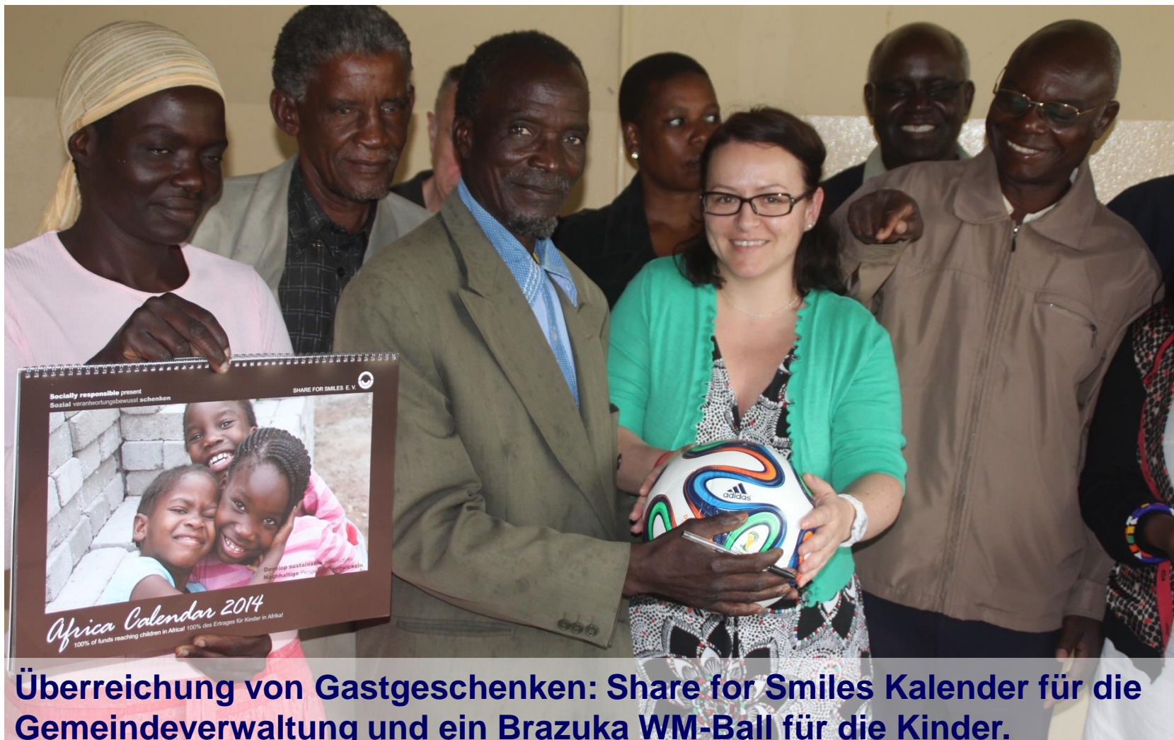
Überreichung von Gastgeschenken: Share for Smiles Kalender für die Gemeindeverwaltung und ein Brazuka WM-Ball für die Kinder. (Vielen Dank an der Stelle für die Unterstützung bei der Sporttenne Stelzer Karlshuld)