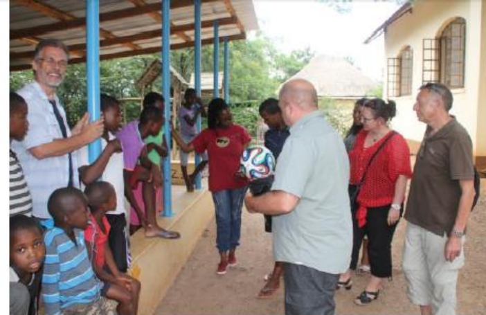
Überreichung des Fußballs für das Kinderzentrum.