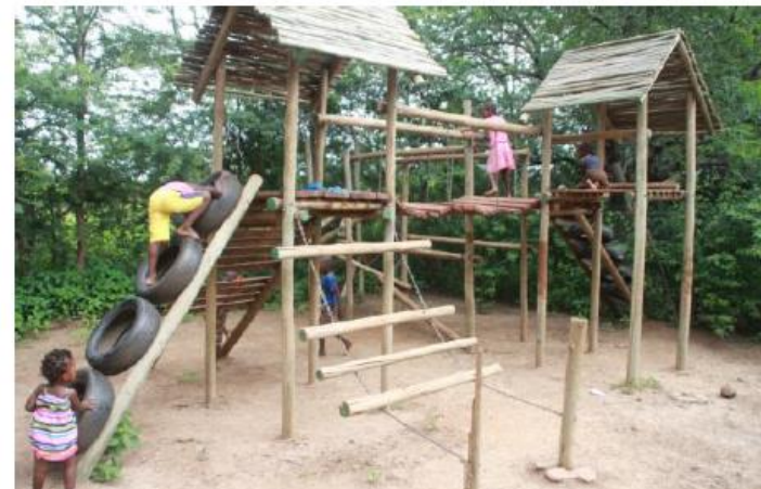
Der Spielplatz im Kinderzentrum.