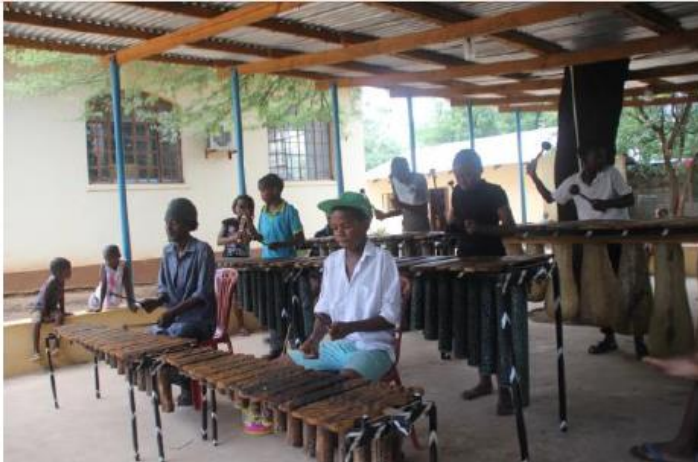
Die talentierte Marimba Band in Aktion.