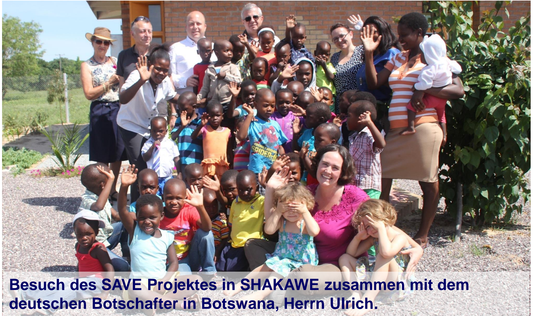
Besuch des SAVE Projektes in SHAKAWE zusammen mit dem deutschen Botschafter in Botswana, Herrn Ulrich.