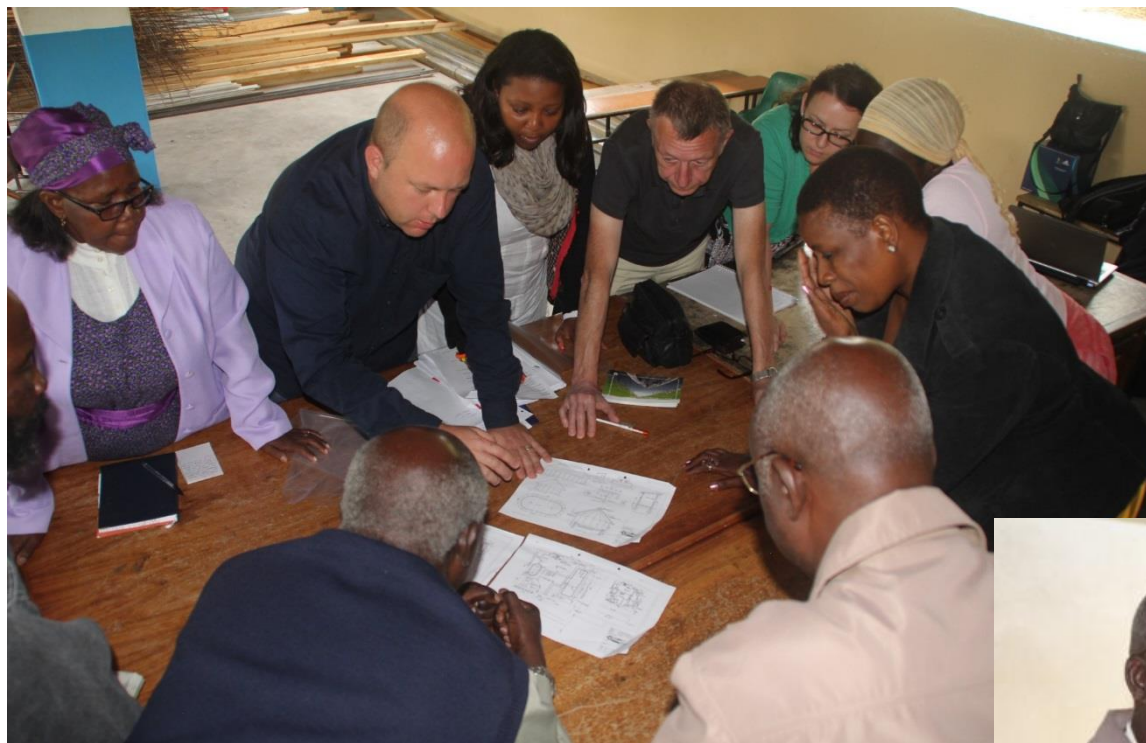
Besprechung aktueller Baupläne und gemeinsame Klärung von Fragen zum geplanten Projekt.

Der zukünftige Leiter der Bibliothek (links) und ein Vertreter der Gemeindeverwaltung